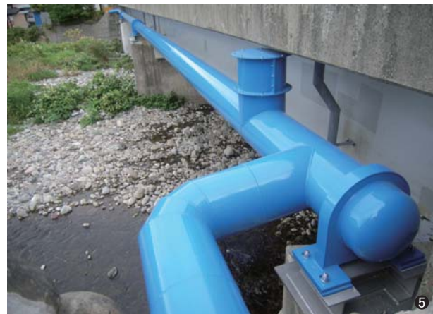
⑤真瀬橋(秋田県) 200A(ポリ)/400A L=49.56m