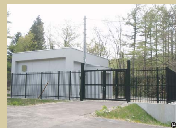
⑭フェンス・門扉(北海道)