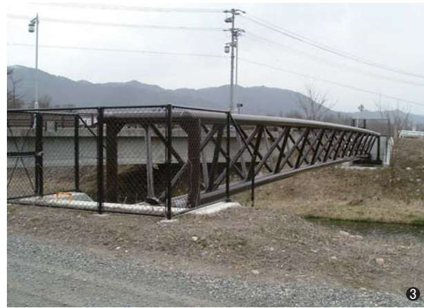
③等々橋水管橋(長野県) 200A/300A L=36.1m