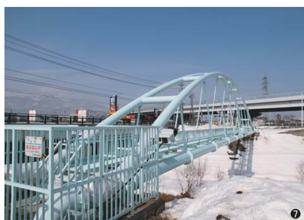
⑦琴似発寒川水管橋(北海道) 500A 2条 支間長 53.9m ~耐震補強