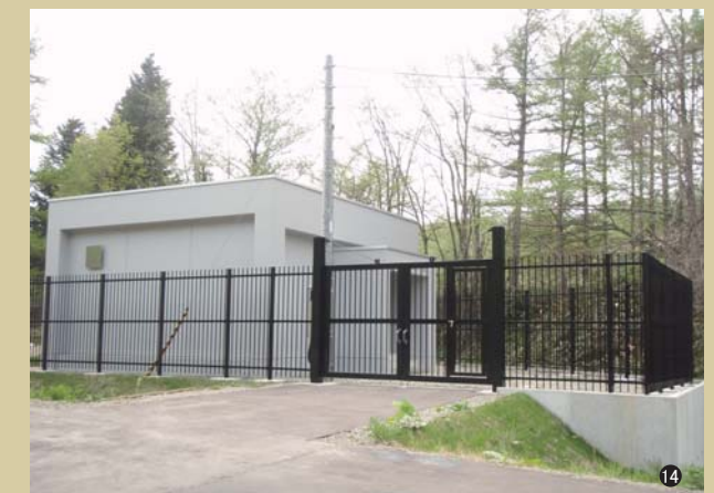
⑭フェンス・門扉(北海道)