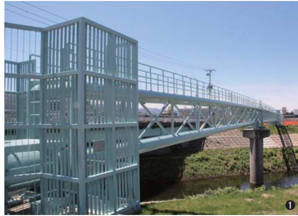
①中の川第1水管橋(北海道) 400A/500A L=81.2m

●主要仕入先 住金物産(株)・(株)軽日軽エンジニアリング 阿部鋼材(株)・前澤工業(株)・(株)オクダソカバ ナブコシステム(株)・横浜ゴムMBH(株)