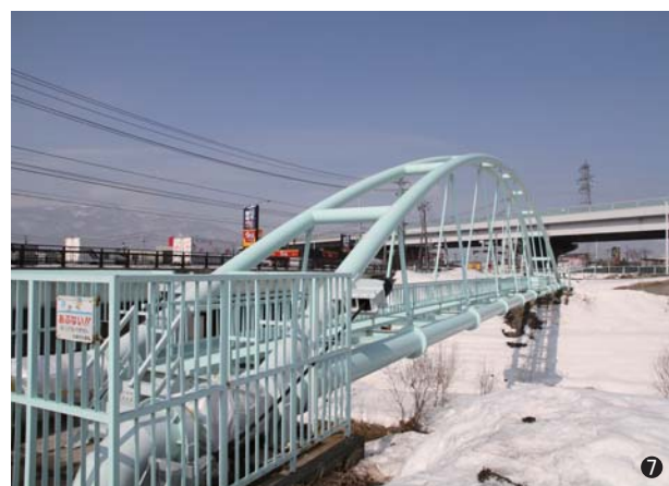
⑦琴似寒寒川水管橋(北海道) 500A 2条 支間長 53.8m ~耐震補強