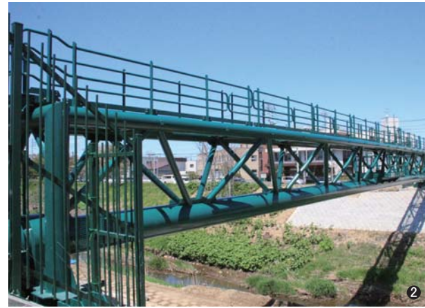
②新川水管橋(北海道) 500A/600A L=54.64m