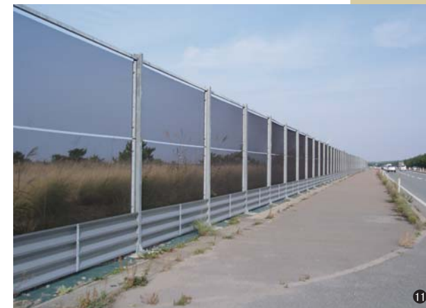
⑪樹脂ネット防雪柵(秋田県) RP-315M