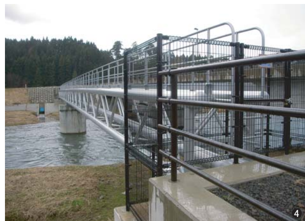
④荒瀬川水管橋(山形県) 250A/φ325 L=61.7m