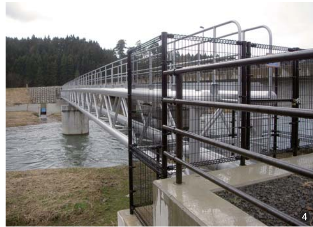
④荒瀬川水管橋(山形県) 250A/φ325 L=61.7m