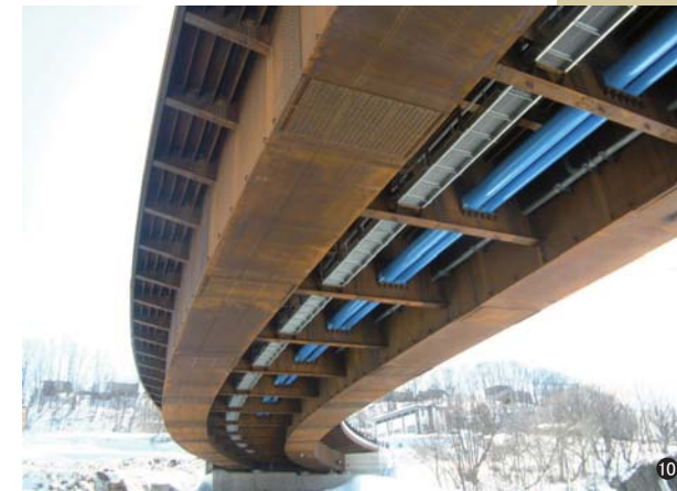
⑩新御料橋(北海道) 100A/250A L=93.288m 350A/450A L=93.434m