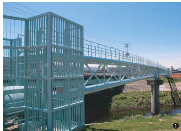
①中の川第1水管橋(北海道) 400A/500A L=81.2m