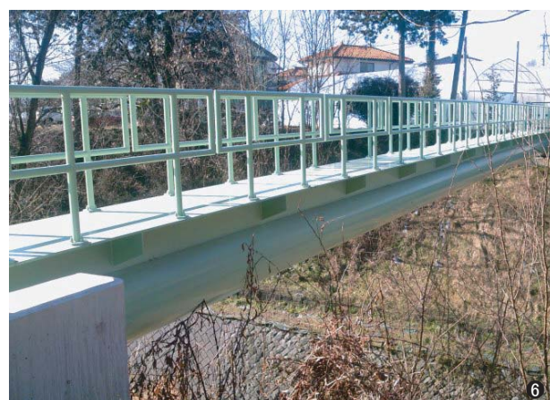
⑥飯田2号橋(長野県) 700A L=33.3m