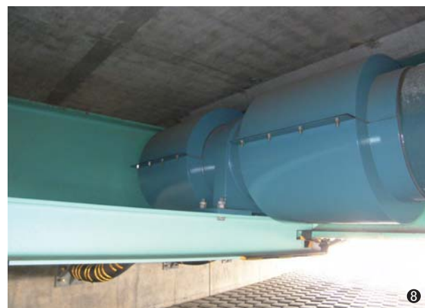
⑧新北郷橋(北海道) 350A/450A 2条 橋長=104.5m ~落橋防止