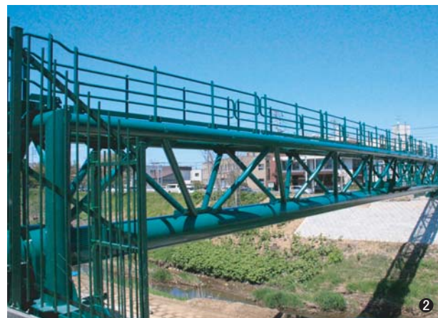
②新川水管橋(北海道) 500A/600A L=54.64m