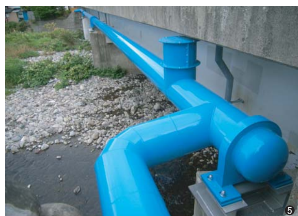
⑤真瀬橋(秋田県) 200A(ボリ)/400A L=49.55m