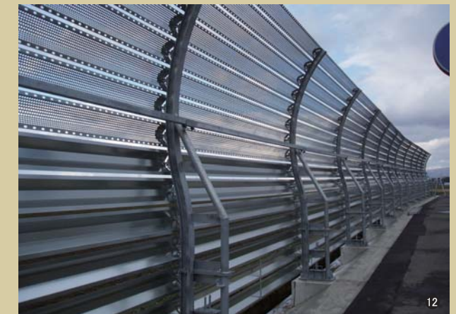
⑫高性能吹止柵(山形県) RF-S40MH