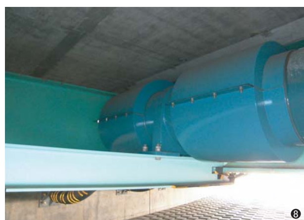
⑧新北郷橋(北海道) 350A/450A 2条 橋長=104.5m ~落橋防止