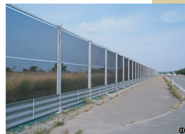
⑪樹脂ネット防雪柵(秋田県) RP-315M