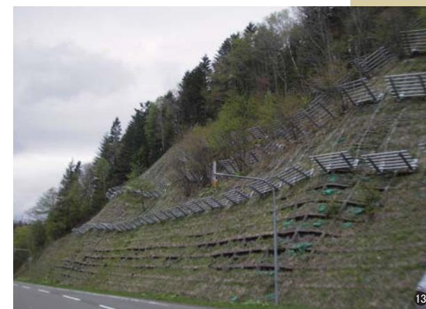
⑬雪崩予防柵(北海道) RV=1275 (H=1.5 W=2.75) 66基