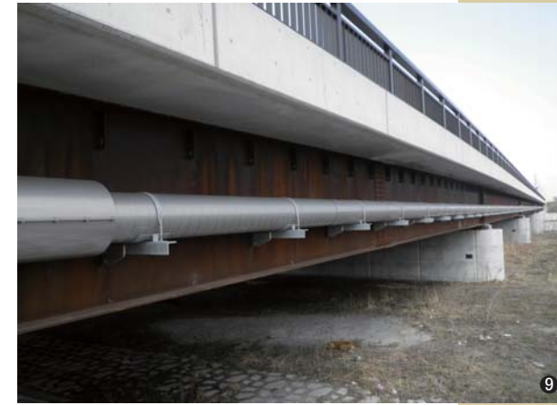
⑨大成橋(北海道) 250A/φ350 L=187.43m