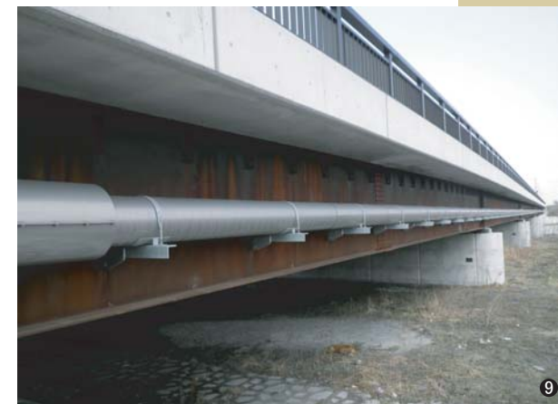
⑨大成橋(北海道) 250A/φ350 L=187.43m