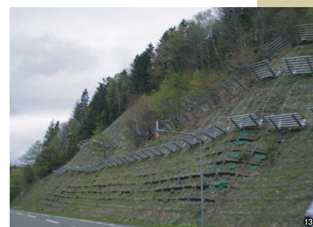
⑬雪崩予防柵(北海道) RV=1275 (H=1.5 W=2.75) 66基