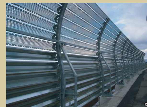
⑫高性能吹止柵(山形県) RF-S40MH