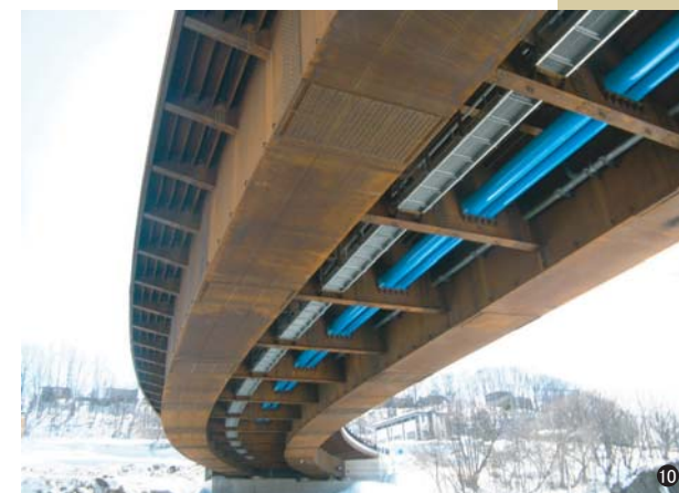
⑩新御料橋(北海道) 100A/250A L=93.268m 350A/450A L=93.434m