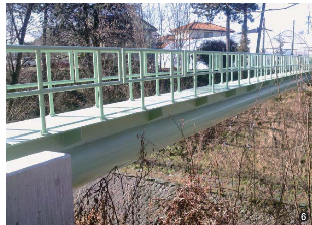
⑥飯田2号橋(長野県) 700A L=33.3m