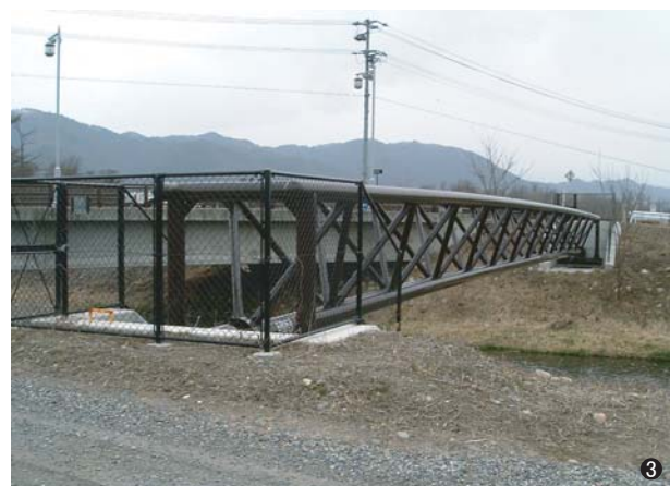
③等々橋水管橋(長野県) 200A/300A L=36.1m